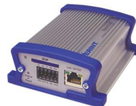
IP kamery MPEG4